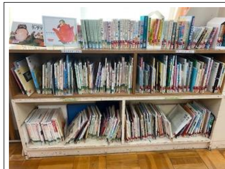
えほん むかしばなし