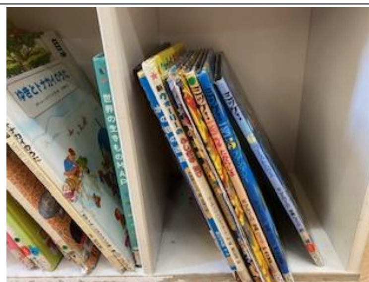
ミッケなどおおきなえほん