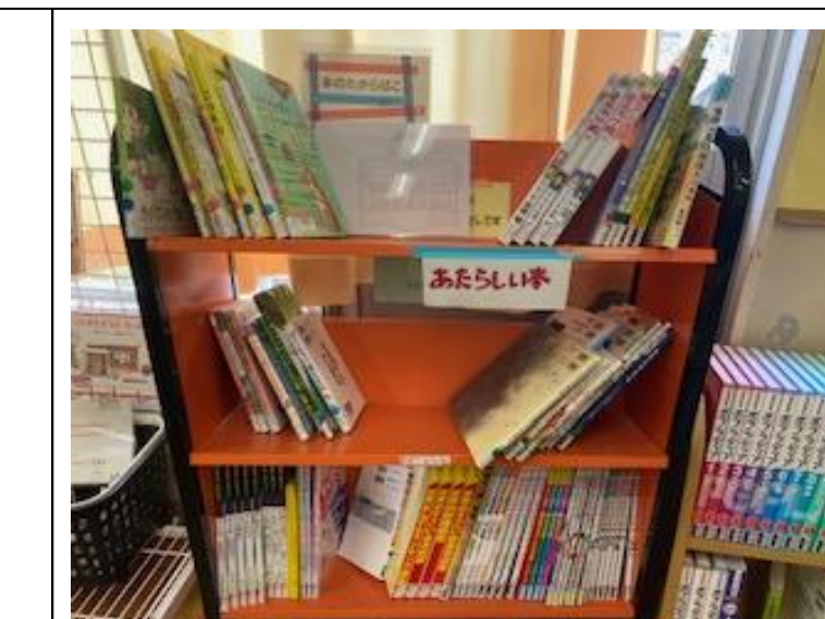
あたらしいほん…えほんをえらんで ください