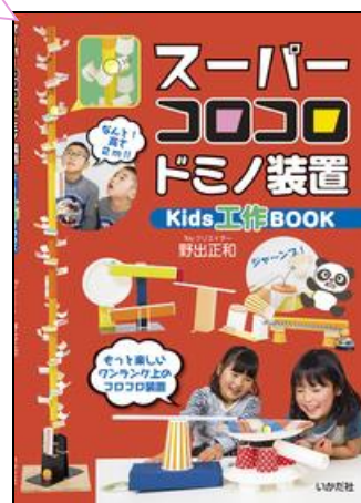
「スーパーコロコロドミノ装置」 野出 正和//著 いかだ社