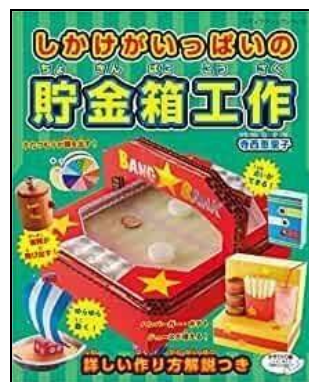
「しかけがいっぱいの貯金箱工作」 ななもり さちこ//作 たかお ゆうこ//絵 福音館書店