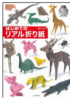
「はじめてのリアル折り紙」 福井 久男//著 河出書房新社

コインを入 い れるとおみくじがでたり、コイン でエアーホッケーをしたり、ボーリングなど で あそ べるおもしろいしかけがいっぱい。