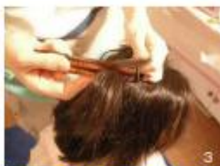
3 髪を小分けにし、水で濡らしたクシで根元から先端までとかす。とかすごとにクシを明らかに濡らし、シラミが付着していないことを確認する。付いている場合は水洗いをする。同じ箇所を2〜3回くらいとかす。