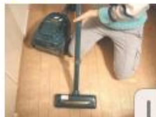
床に掃除機をかける。