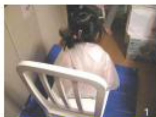
1 ビニールシートを敷いたイスにレインコートを着せて座らせる。

スキグシが入手できない場合には、卵や幼虫を完全に除くことはできませんが、できるだけ目の細かいクシで代用し、成虫を取ってあげましょう。