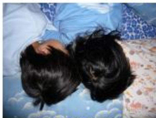
お昼寝や深い寝のとき