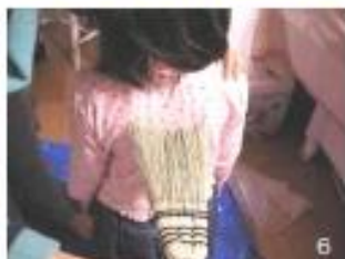
6 コートを脱がせ、袋に