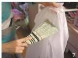
7 コートやシートにハケを