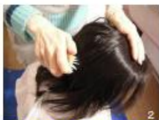
2 クシどおりをよくするために、ブラシで全体をとがし髪のもつれをとる。