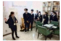
人権プラザの方とフィールドワーク